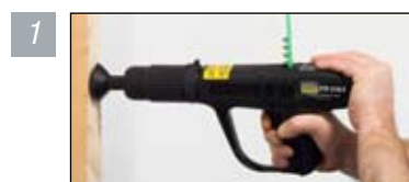
PTP 27 ALX