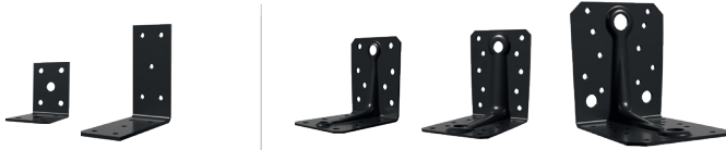
1. Lette vinkelbeslag

Vores sortlakerede beslag giver en lang række muligheder for, at bygge en stærk og sikker trækonstruktion.