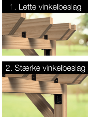
1. Lette vinkelbeslag