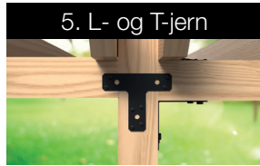
5. L- og T-jern